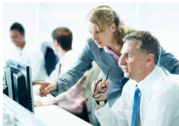
Das Wesentliche im Blick – Implementierung zum Festpreis und innerhalb einer festgelegten Zeitspanne