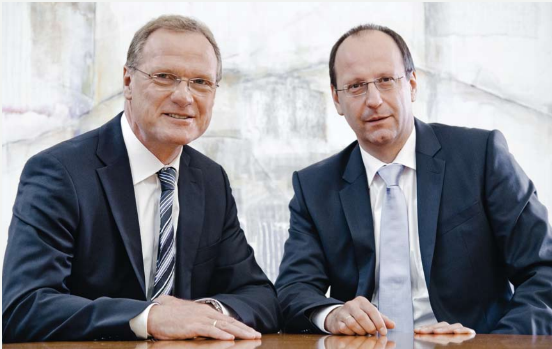
Die Zukunft im Blick – die Geschäftsführung der RZV GmbH

Die RZV GmbH versteht sich als engagiertes mittelständisches Unternehmen der IT-Branche, das auf Basis moderner Informationstechnologie anwenderfreundliche IT-Konzepte für das Gesundheitswesen, den Sozialmarkt und den öffentlichen Bereich realisiert. Die individuellen Anforderungen und Bedürfnisse unserer Kunden stehen dabei im Fokus der Lösungsstrategien. Sei es als Outsourcing-Lösung für kleine und mittlere Krankenhäuser oder als eigenständiges, autonomes System: Die RZV GmbH bietet verschiedene Betreibermodelle, die bestmöglich den Anforderungen der Einrichtung gerecht werden.