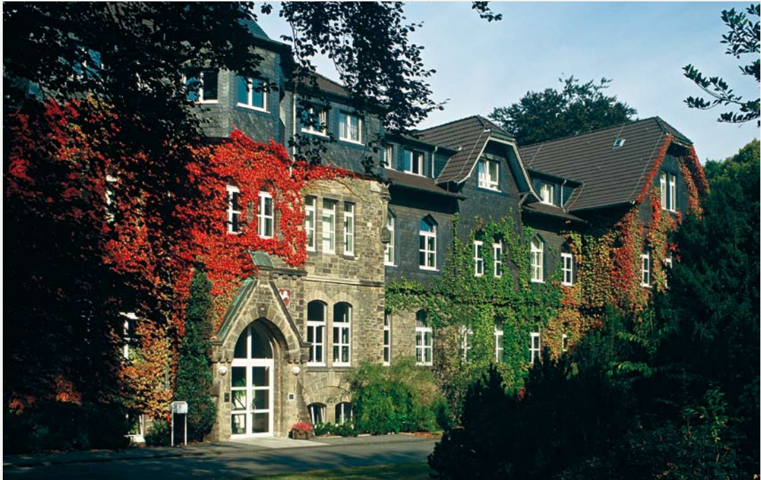
Moderne Informationstechnologie trifft Geschichte: Der Hauptsitz der RZV GmbH in Wetter an der Ruhr