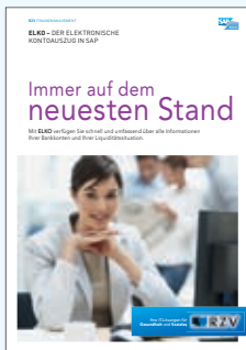
PRODUKTINFORMATION ELKO – der elektronische Kontoauszug in SAP