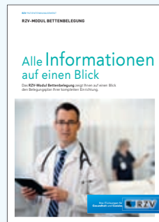
PRODUKTINFORMATION RZV-MODUL BETTENBELEGUNG