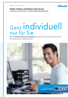
PRODUKTINFORMATION WORD-FORMULAR-VERWALTUNG IN SAP für das IS/Social-Klientenmanagement