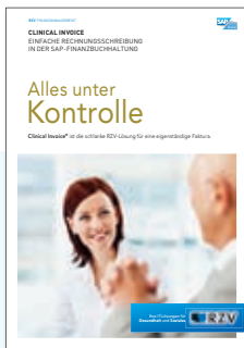
PRODUKTINFORMATION CLINICAL INVOICE – Einfache Rechnungsschreibung in der SAP-Finanzbuchhaltung